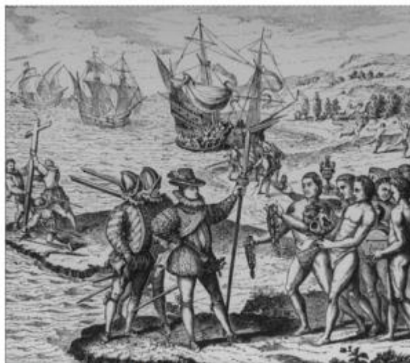
Grabado publicado entre 1601 y 1615. Ilustra la llegada de Colón a América.

La siguiente imagen representa la llegada de los primeros españoles a América. Obsérvala con atención y luego responde las preguntas.